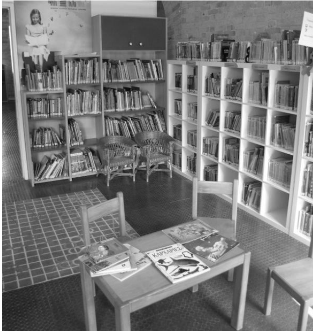
Fot. 4. Czytelnia dla dzieci w Głównej Bibliotece Publicznej w Korfu