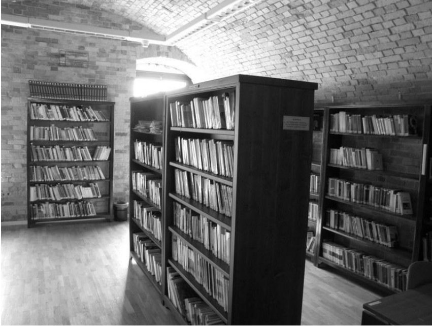
Fot. 3. Czytelnia tematyczna z wolnym dostępem w Głównej Bibliotece Publicznej w Korfu