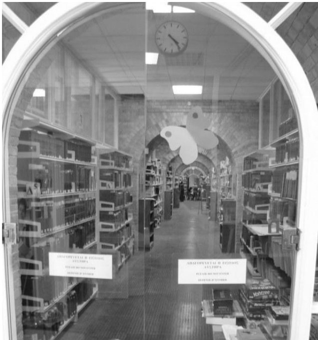
Fot. 5. Główna Biblioteka Publiczna w Korfu