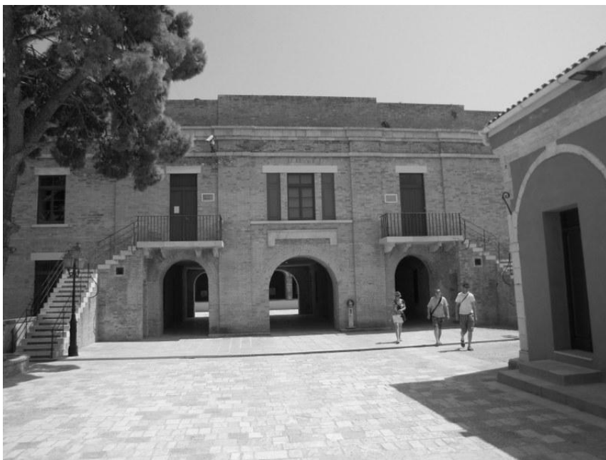
Fot. 1. Siedziba Głównej Biblioteki Publicznej w Korfu